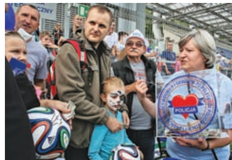
Licytacja piłek Brazuca