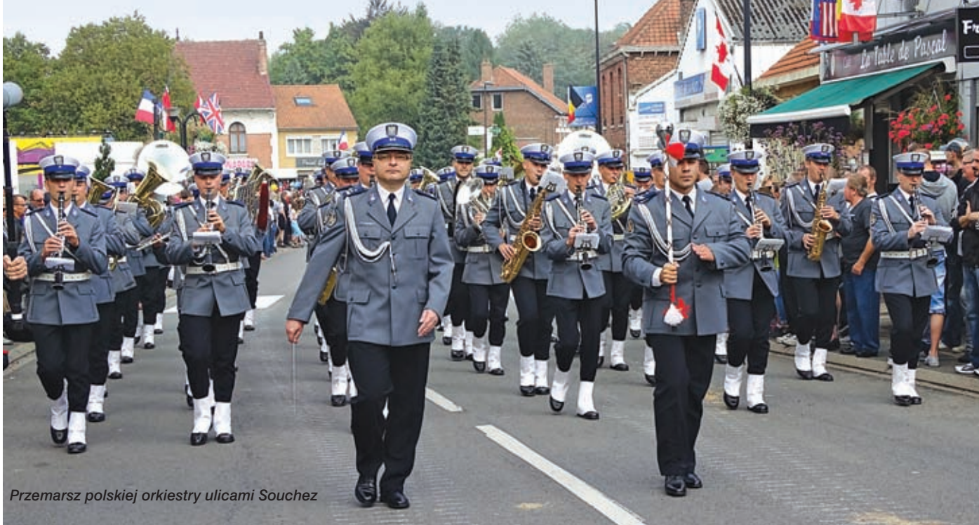
Przemarsz polskiej orkiestry ulicami Souchez