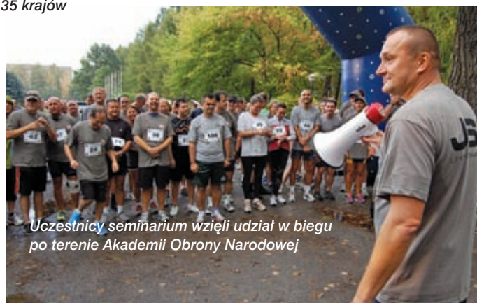
Uczestnicy seminarium wzięli udział w biegu po terenie Akademii Obrony Narodowej

oprac. CZAK