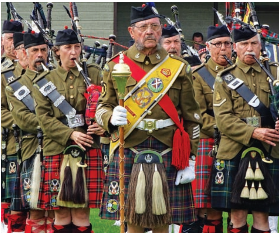
Orkiestra szkocka wyróżniała się oryginalnością strojów