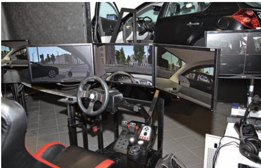
Uproszczone stanowiska kierowców wyposażone są w trzy monitory, kierownicę z pedałami i dźwignią zmiany biegów

Symulator składa się ze stanowisk instruktora i operatora, kabiny samochodu osobowego na ruchomej platformie o sześciu stop-