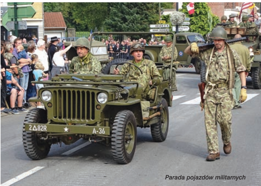
Parada pojazdów militarnych