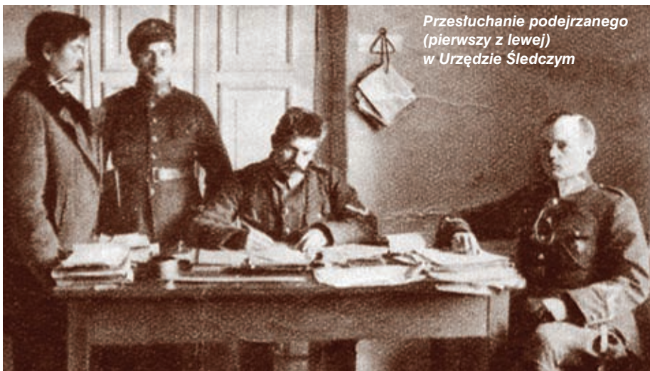
Przesłuchanie podejrzanego (pierwszy z lewej) w Urzędzie Śledczym

JERZY PACIORKOWSKI zdj. „Na Posterunku”, „GAiPP”, archiwum