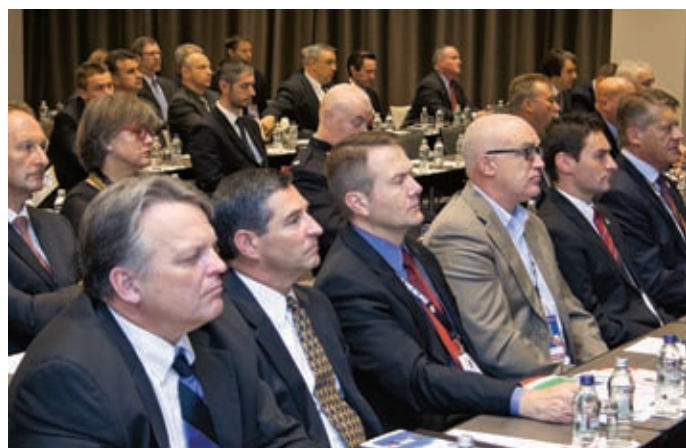
W tegorocznym seminarium wzięło udział prawie 200 funkcjonariuszy z 35 krajów

Nierozłącznym elementem policyjnej pracy jest sprawność fizyczna, dlatego też uczestnicy seminarium mieli możliwość wzięcia udziału w biegu terenowym na dystansie ponad 3 km, zorganizowanym na terenie Akademii Obrony Narodowej. Warto zaznaczyć, że mimo padającego deszczu nikt nie zrezygnował i wszyscy dotarli do mety. ■