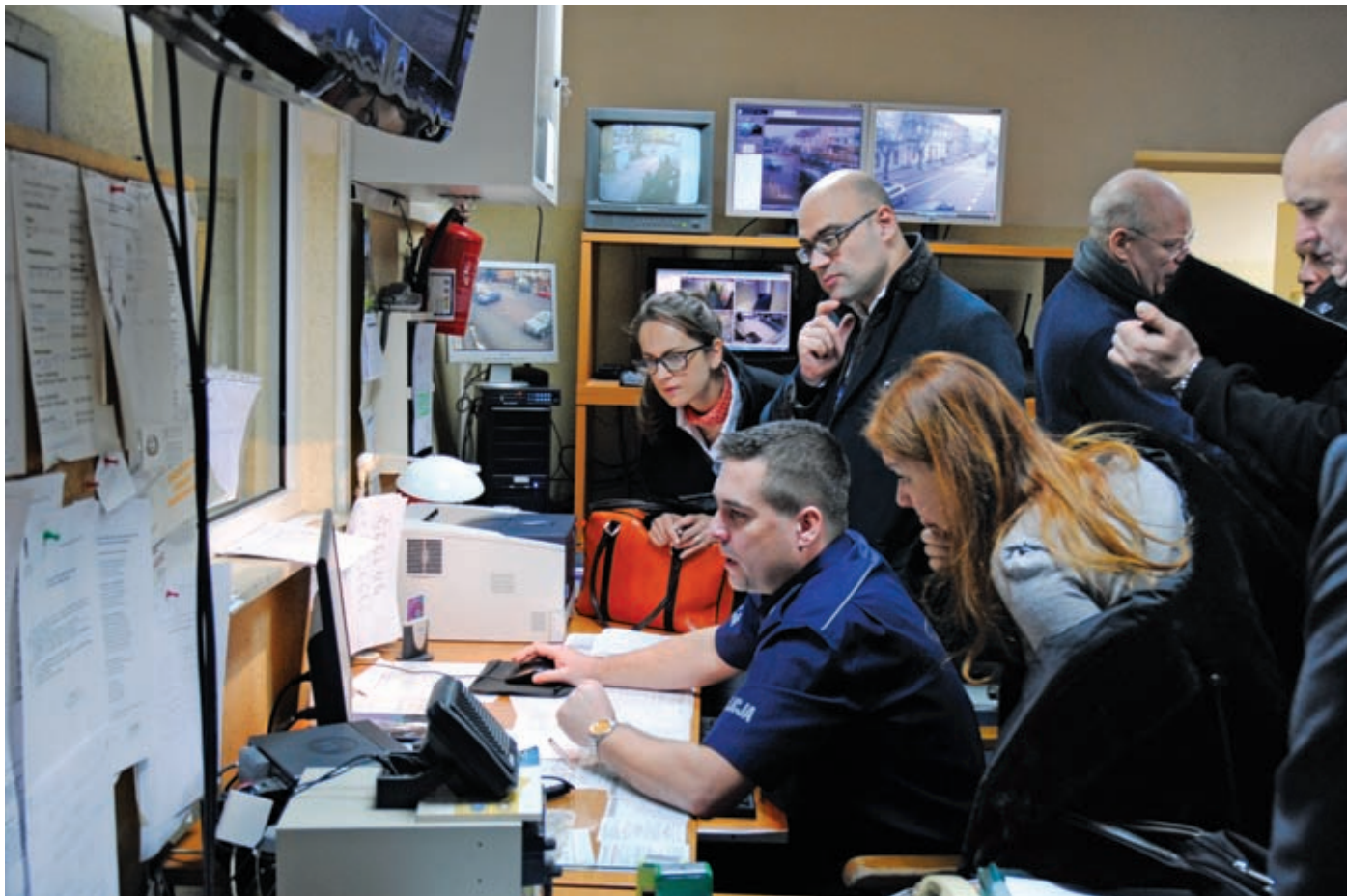
Eksperti Komitetu Ewaluacyjnego na Stanowisku Kierowania KPP w Mińsku Mazowieckim

nowie oraz w Szkole Policji w Katowicach przez funkcjonariuszy i pracowników WKPM BMWP KGP i Wydziału Koordynacji Międzynarodowej Wymiany Informacji BMWP KGP. Programem objęte zostały wszystkie województwa. W założeniu szkolenie ma charakter kaskadowy. Trenerzy z Biura SIRENE prowadzą zajęcia z osobami wyznaczonymi przez komendantów wojewódzkich, a ci będą szkolić następnych z podległego im terenu.