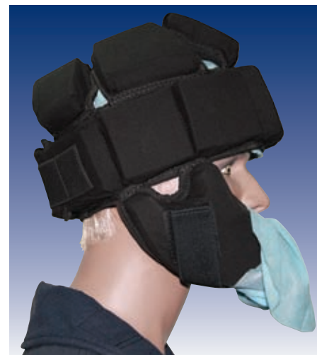
Jest odporny na uderzenia