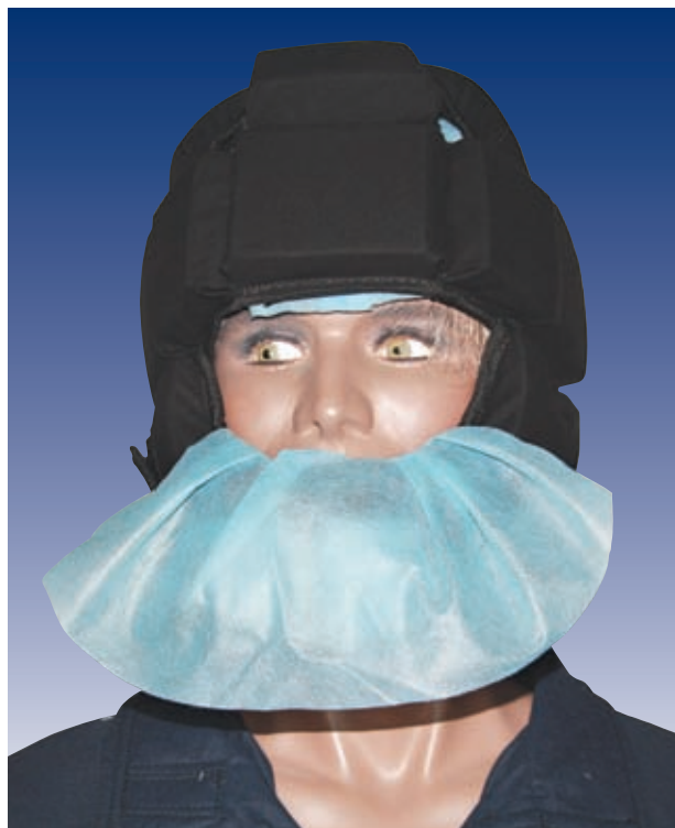
Kask ma dwa wkłady higieniczne