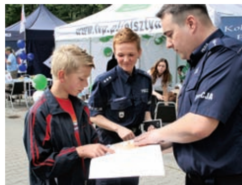
Stoisko miesięcznika „Policja 997”