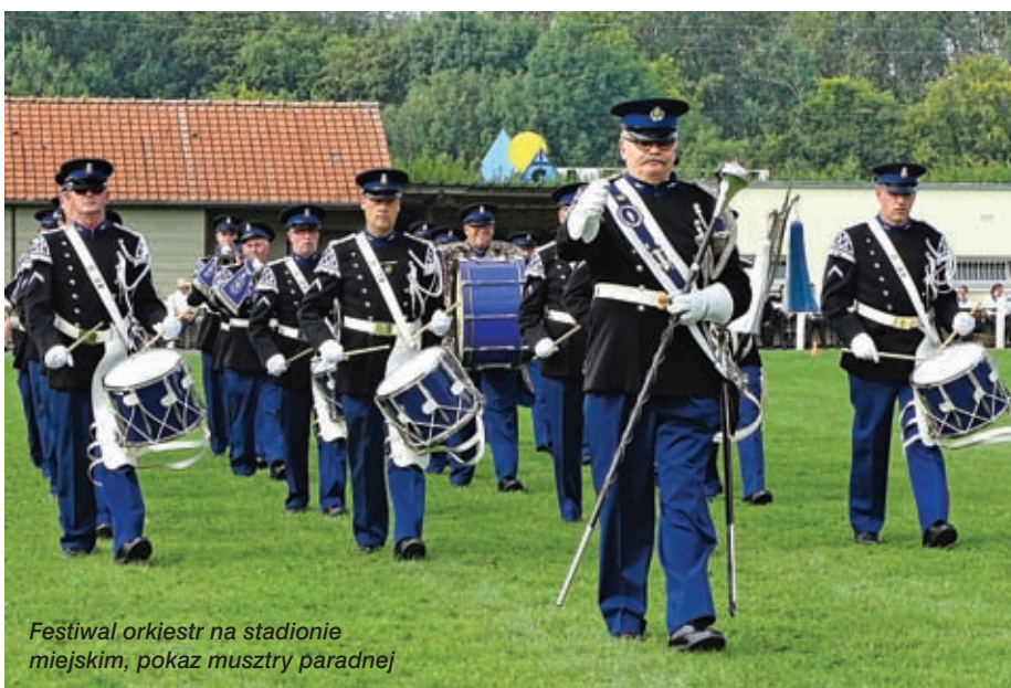
Festiwal orkiestr na stadionie miejskim, pokaz musztry paradnej