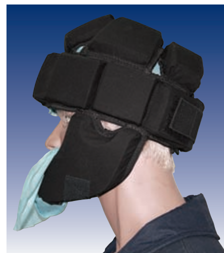
Zabezpiecza wrażliwe miejsca głowy