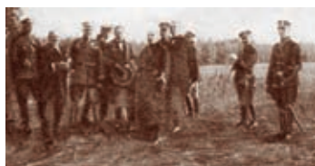
Minister Hübner na granicy

• Komenda Główna PP zakupiła 10 tys. pakietów opatrunkowych, składających się z dwóch bandaży, dwóch ampułek z jodyną, gazy, waty i agrafki. Pakiety przeznaczono dla policjantów okręgów przygranicznych oraz policjantów pełniących służbę zewnętrzną.