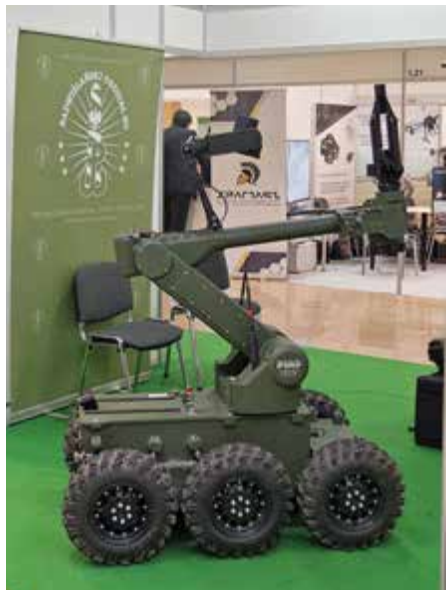
Robot pirotechniczny Straży Granicznej

dział kwot nie powinien dziwić, ponieważ Policja jest największą formacją resortu, liczącą 103 tys. funkcjonariuszy i 25 tys. pracowników.