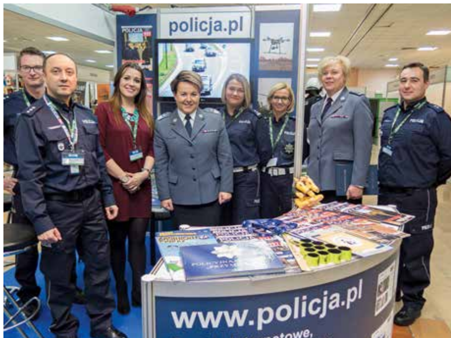
Stoisko polskiej Policji wzbudziło duże zainteresowanie uczestników

Udział w dyskusji insp. Dariusza Minkiewicza związany był z pełnionym przez podległe mu Biuro Prewencji KGP nadzorem nad specjalistycznymi uzbrojonymi formacjami ochronnymi, do których zgodnie z ustawą o ochronie osób i mienia należy ochrona obiektów infrastruktury krytycznej,