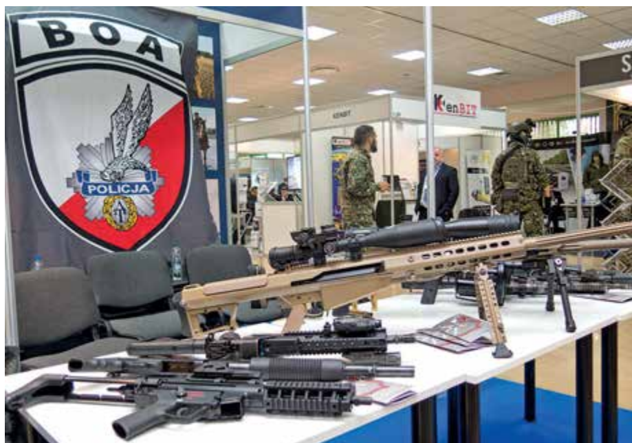
Prezentacja uzbrojenia funkcjonariuszy Biura Operacji Antyterrorystycznych