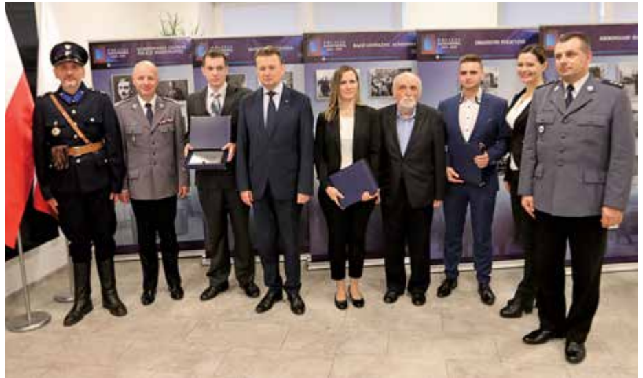
Zwycięzcy konkursu z kierownictwem MSWiA i Policji

– Pracę obroniłem w te wakacje, niedługo potem okazało się, że zostałem przyjęty do Policji. Służba jako pomysł na życie przyszła mi do głowy dwa, trzy lata temu: zawód policjanta zawsze kojarzył mi się bardzo dobrze, choć nie zawsze jest