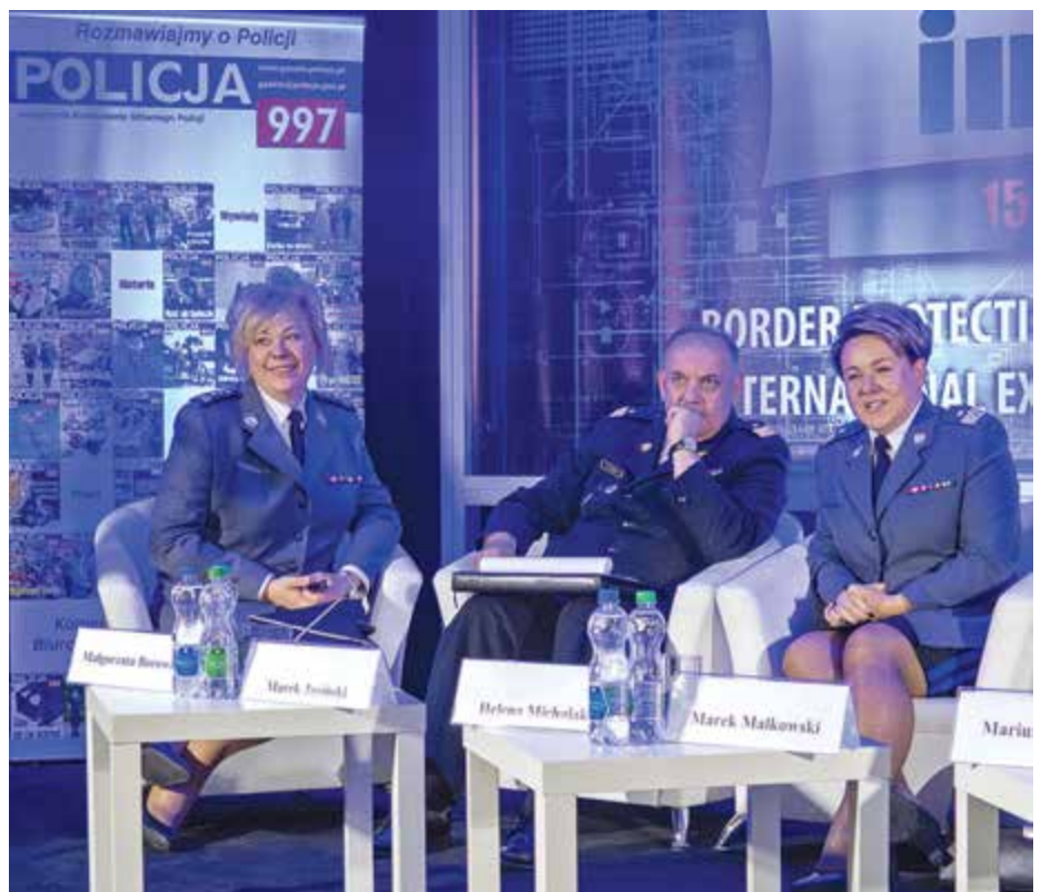
Panel poświęcony modernizacji służb mundurowych

W samym centrum sali znajdowało się stoisko polskiej Policji, przygotowane przez Biuro Komunikacji Społecznej KGP przy współudziale biur Operacji Antyterrorystycznych, Ruchu Drogowego i Międzynarodowej Współpracy Policji. Chętni mogli porozmawiać z policjantami, obejrzeć wyposażenie pododdziałów szturmowych i otrzymać kilka wybranych numerów czasopisma „Policja 997”, które objęło imprezę patronatem medialnym, oraz grę edukacyjną dla najmłod-