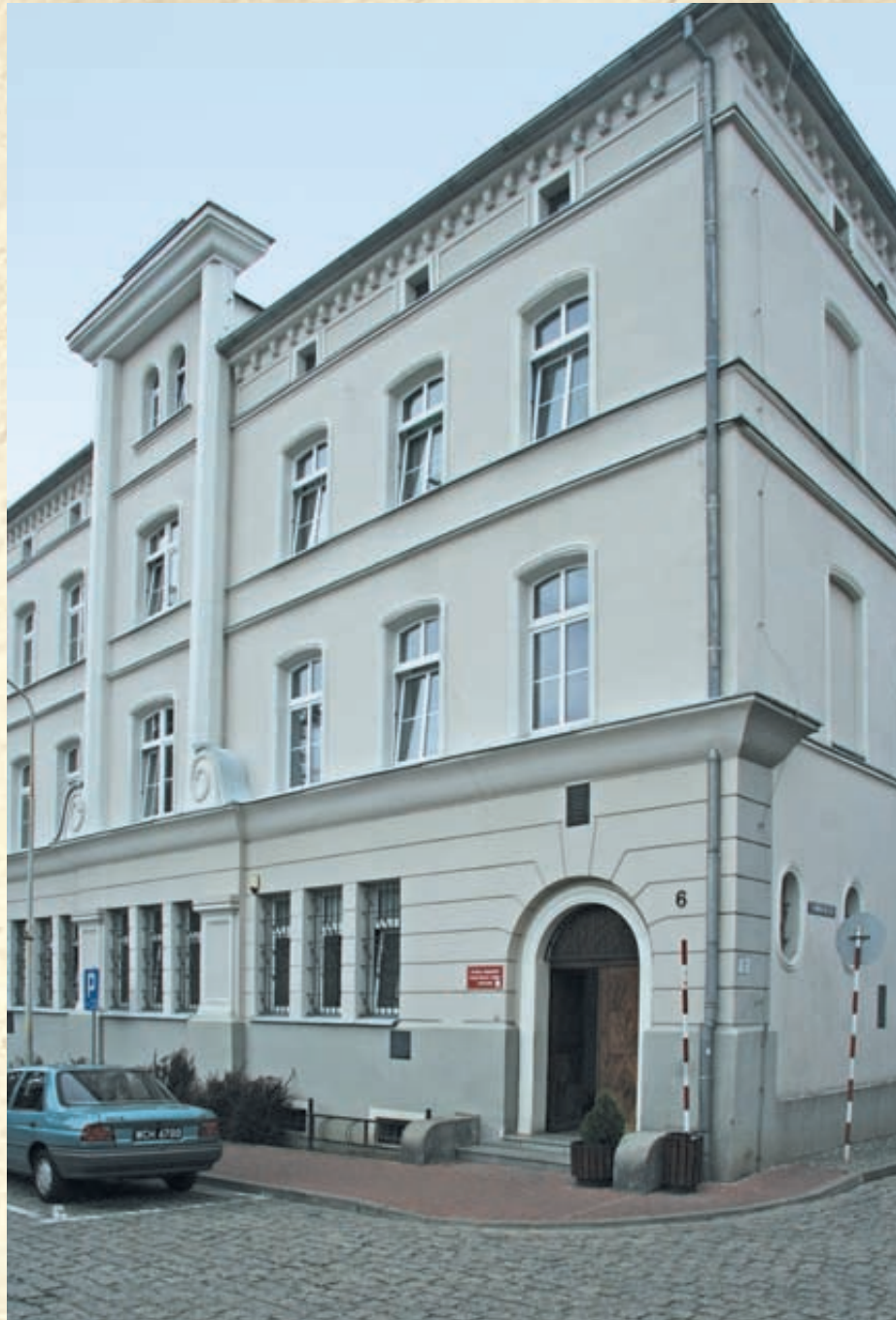
Wejście do budynku banku

Szczęśliwym zbiegiem okoliczności jedna z owych 500-złotówek „wypłynęła” już dzień później, 1 października 1962 roku, w sklepie tekstylnym w woj. opolskim. Klientka chciała zapłacić nią za kapę na łóżko. Gdy zorientowała się, że sprzedawczyni zamierza wezwać milicję, próbowała zabrać banknot, a później przekupić ekspedientkę. Usiłowania spełzły jednak na niczym, podobnie jak próba ucieczki ze sklepu. Dzielna pracownica zamknęła kobietę na zapleczu do czasu przybycia funkcjonariuszy. Okazało się, że klientka jest żoną jednego z mężczyzn typowanych przez milicjantów na uczestnika skoku. W mieszkaniu małżeństwa znajdowało się sporo pie-