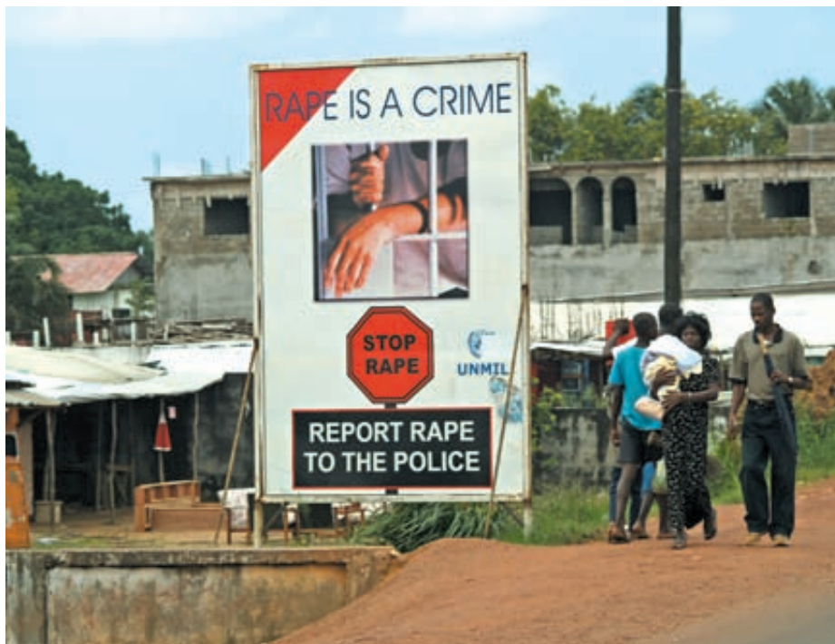
Misja ONZ uświadamia Liberyjczykom, że gwałt to zbrodnia