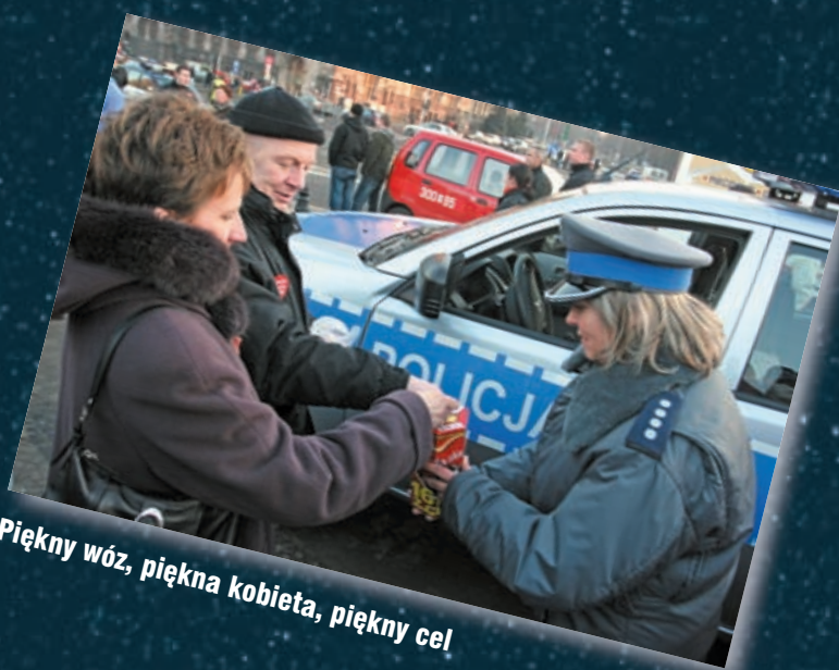
Piękny wóz, piękna kobieta, piękny cel