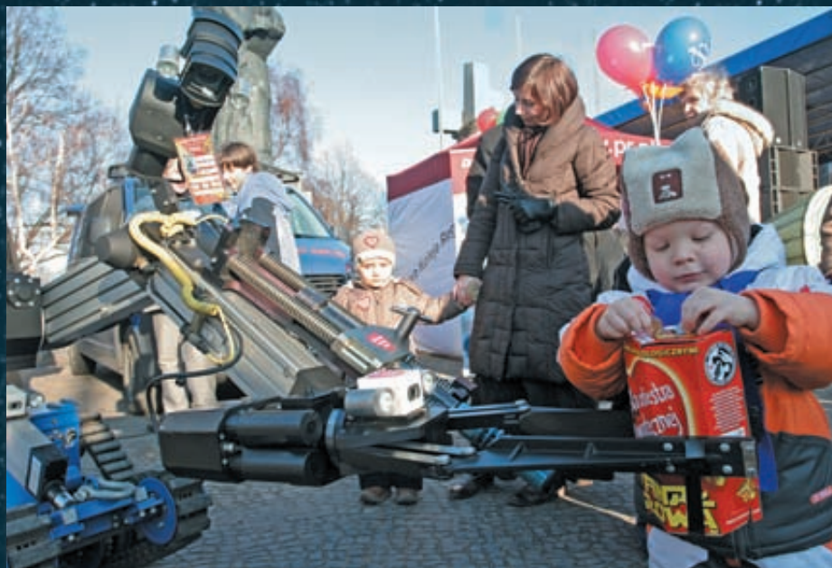
Robot poznańskich antyterrorystów bacznie obserwował, ile kto wrzuca do puszki, którą trzymał