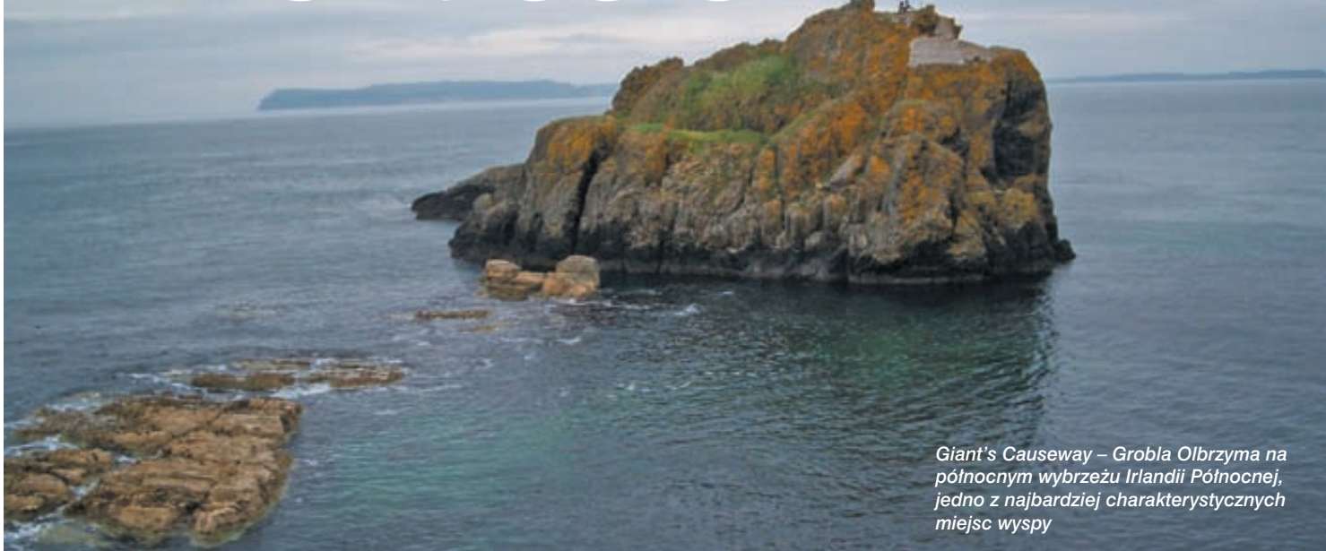
Giant's Causeway – Grobla Olbrzyma na północnym wybrzeżu Irlandii Północnej, jedno z najbardziej charakterystycznych miejsc wyspy

wykladowców akademickich, którzy od wielu lat pracują na uniwersytetach Ulster i Queen. I osoby, które po wielu latach emigracji właśnie w Irlandii Północnej postanowiły zamieszkać na dłużej. Po otwarciu granic dla nowych członków UE przyjechało tam już, jak szacują lokalne władze, od 35 do 40 tys. Polaków. To bardzo widoczna grupa. Okazało się, że instytucje czy duże zakłady pracy musiały zacząć uwzględniać język polski w swoich informacjach. Dotyczy to też policji – Police Service of Northern Ireland (PSNI). Departament Kadr i Szkolenia PSNI zaproponował, żeby zaprosić policjanta z Polski, który mógłby usprawnić komunikację z polskimi emigrantami, pomóc w tłumaczeniu im na spotkaniach różnic w prawie i policyjnych przepisach, stworzyć informacje i komunikaty przeznaczone dla Polaków. Praca miła, tym bardziej że – jak się okazało – akurat tam nasi rodacy nie sprawiają bardzo dużych kłopotów policji. Są to raczej takie same „grzechy”, jak w Polsce: jazda pod wpływem alkoholu, brak ubezpieczenia samochodu i kierowcy, awantury i bójki pod wpływem alkoholu. Zaledwie kilka spraw dotyczyło bardzo poważnych przestępstw kryminalnych. Podczas mojego pobytu odwiedziłam też więzienie, gdzie przebywało kilkunastu Polaków.