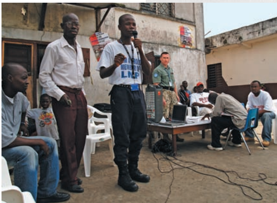
Kandydatów na policjantów misjonarze szukają w całym kraju

– Posterunek to pokój i korytarz; załogę stanowi sześciu chłopaków – Maciejewski opowiada o warunkach pracy policjantów w liberyjskim terenie. – Gdy w pokoju trwa przesłuchanie zatrzymanego, reszcie policjantów pozostaje korytarz, który jest jednocześnie biurem: tu przyjmuje się interesantów i prowadzi dokumentację, czyli zeszyt formatu A4. Posterunek dzia-