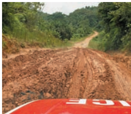
Drogi pozostawiają wiele do życzenia

Na misji łatwiej się żyje tym, którzy są otwarci na różnorodność, potrafią zaakceptować odmienny niż własny stosunek do życia. Dużym problemem jest bariera języ-