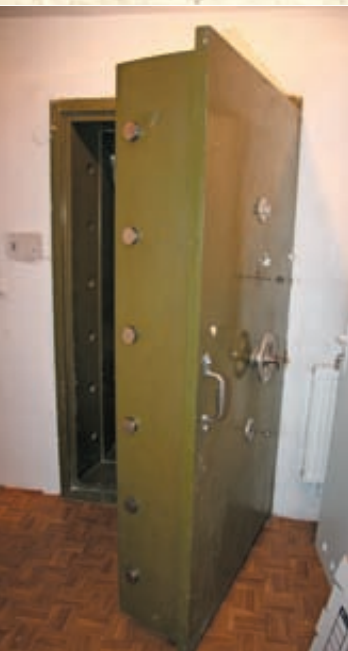
Skarbcza strzegły te drzwi, ale sprawcy sprytnie je ominęli

– W całym domu mieliśmy pozakładane podsłuchy: pod stołem, krzesłami, w szafkach, za obrazami, jedną pluskwę znaleźliśmy nawet przy kołowrocie studni – uśmiecha się Stelmarczyk. – Mój najmłodszy brat celował w ich wykrywanie. Prócz tego w sąsiedztwie milicja wynajęła mieszkanie, z którego prowadzono obserwację naszego domu.