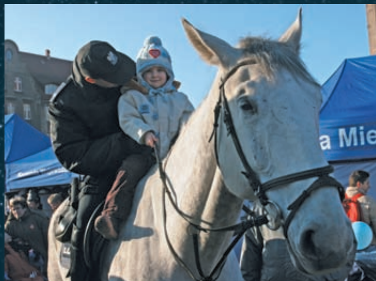
Trzeba było zasłużyć na taką przejażdżkę