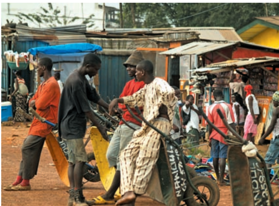
Właściciel taczki ma status biznesmena