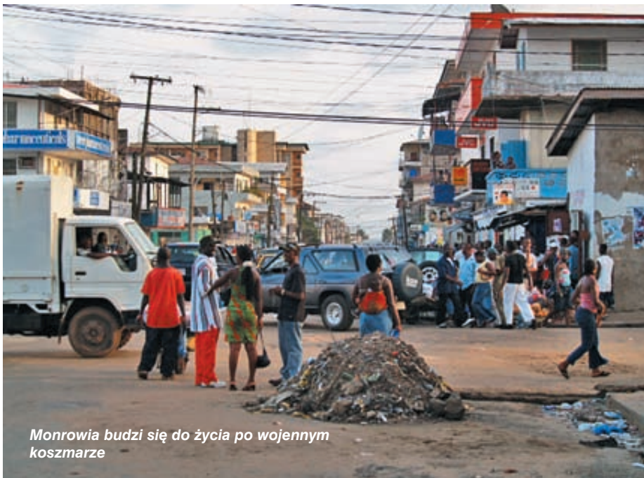
Monrovia budzi się do życia po wojennym koszmarze