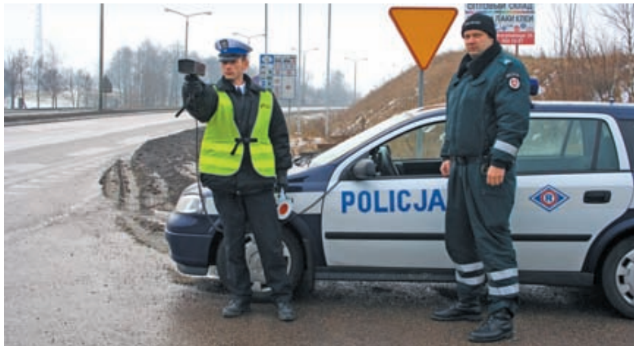
Polsko-litewskie patrole policji są jeszcze sporą atrakcją

niż godzinę i nie sięgał dalej niż 100 km. Polska zrobiła takie same obostrzenia dla litewskich policjantów, choć z innymi sąsiedami z grupy Schengen nie ma ograniczeń.