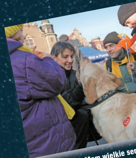
Jestem z Policji. Mam wielkie serduszko