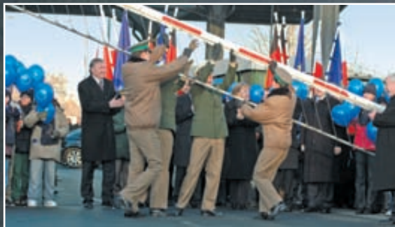
21 grudnia 2007 r. – Porajów